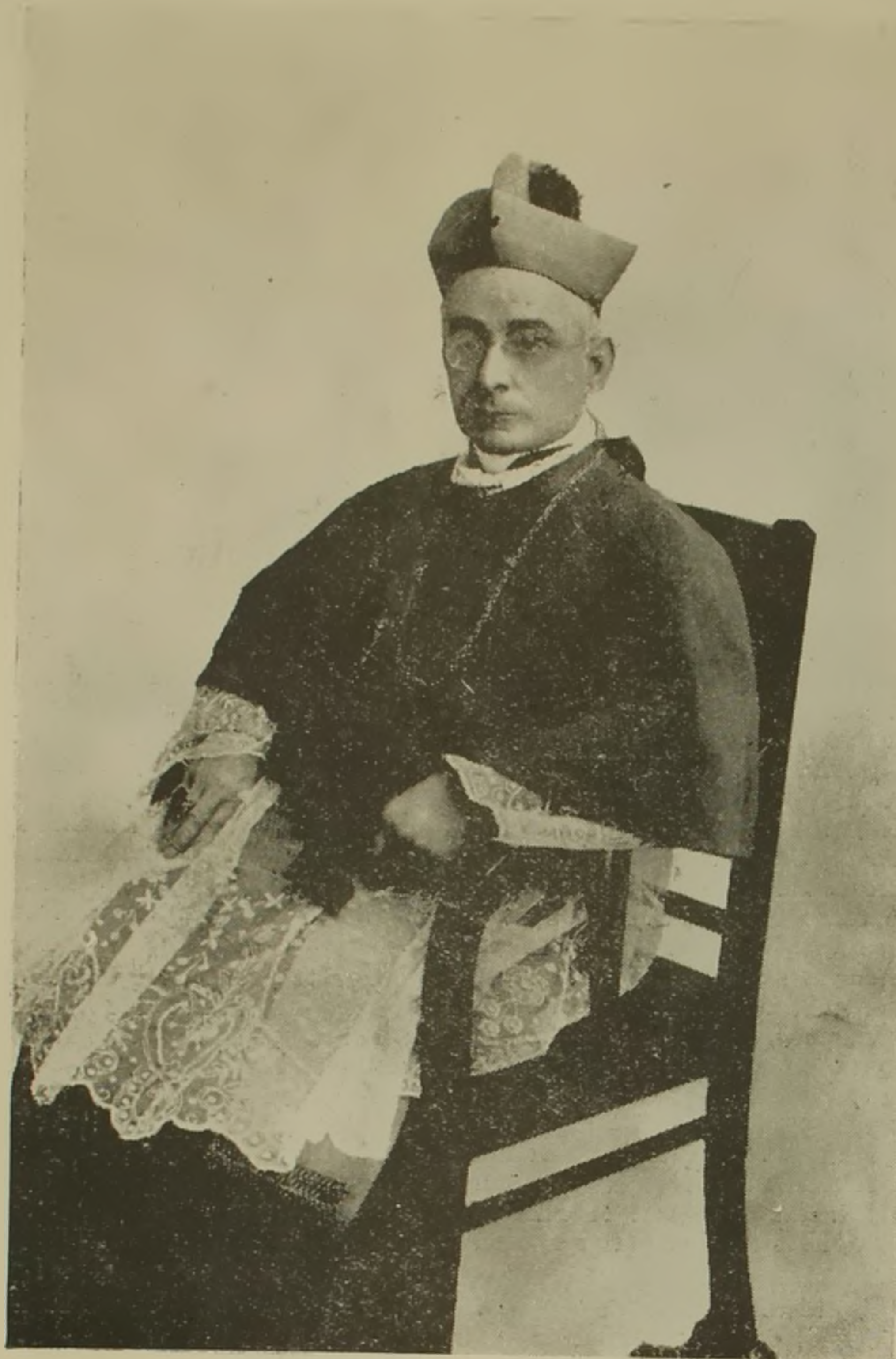
MONS. DON TOMÁS CAMACHO OBISPO DE SALTO:

La Liga de Damas Católicas del Uruguay y muy especialmente los Comités de los departamentos de vuestra Diócesis ponen sus servicios, como "auxiliares de parroquias" a vuestra disposición y prometen secundar siempre a la medida de sus fuerzas el programa de nuestro lema: